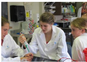
Musée Armand Frappier

Plus d'une personne sur quatre est touchée par les allergies. D'ici 2050, ce sera une sur deux qui en sera atteinte. Il n'est donc pas étonnant qu'on en parle autant ! Visitez la toute nouvelle exposition sur les allergies, à la fois informative, interactive et ludique. On y démystifie ce dérèglement du système immunitaire et on y fait le plein d'idées pour mieux comprendre et vivre avec cette réalité.